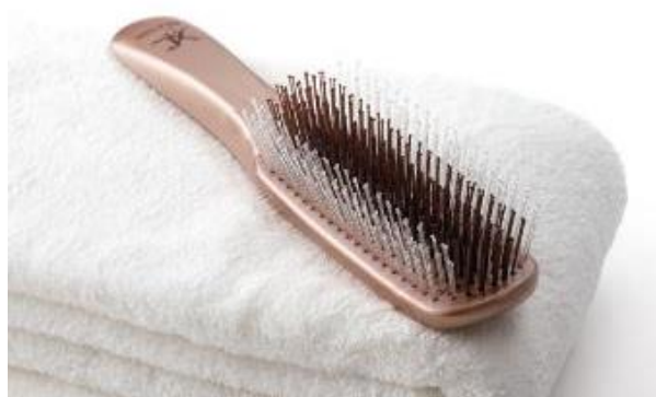
「エックスリ्यूクス エグゼティシャン スカルプブラシ」