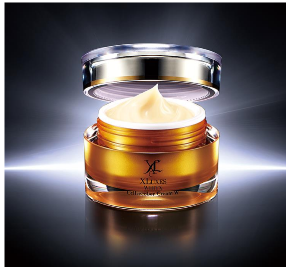
「エックスリュクス セルリカバークリームW (ダブリュー)」

株式会社 ストリーム(東京都港区、代表取締役社長：松井 敏)の子会社の株式会社 エックスワン(東京都港区、代表取締役社長：齊藤 勝久、以下、エックスワン社といいます。)は、先進の技術を応用したヒト幹細胞培養液 *1 配合の美容クリーム、XLUXES(エックスリュクス)セルリカバークリームをさらに進化させた、「XLUXES(エックスリュクス)セルリカバークリームW(ダブリュー)」(1品目1品種、税抜28,570円)を11月1日より直営店舗及びエックスワン社直販サイトや他ECサイト等で販売します。